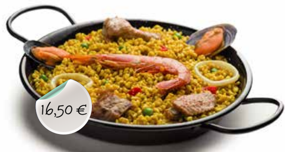
PAELLA AUX FRUITS DE MER Fruits de mer decortiqués, calamar, crevettes, moules, poivron, petits pois